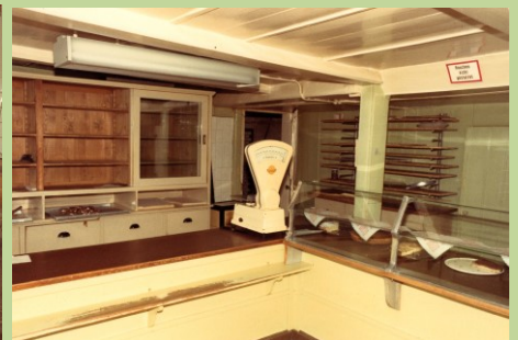
Backofen, Backstube mit Knetmaschine und Ladenbereich im Jahre 1980