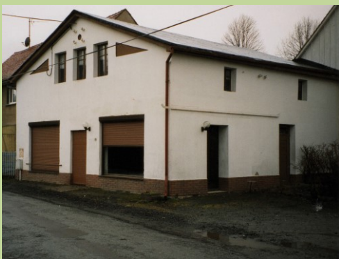
Der Ladenanbau 1999